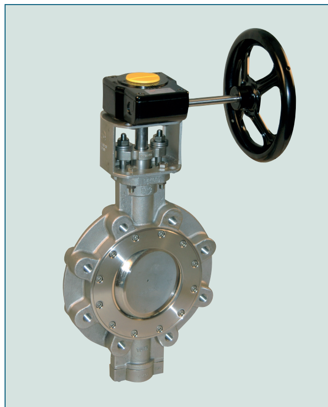
Фланцевый затвор двухэксцентриковой конструкции. Надежное перекрытие потока даже при экстремальных температурах и давлениях.